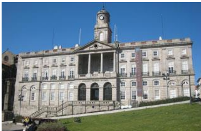
Porto: palazzo della Borsa