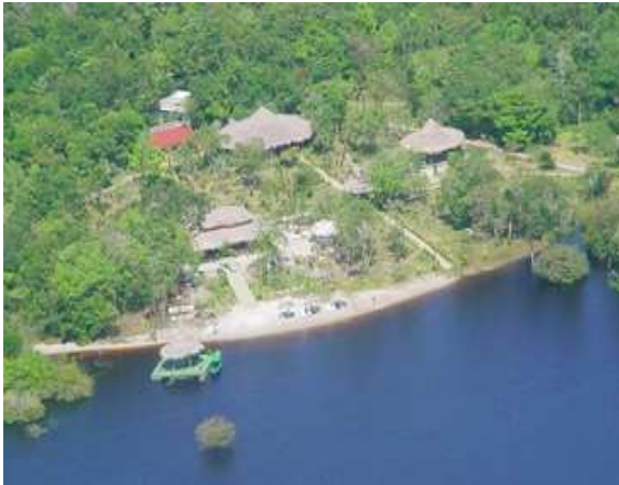
Amazon Ecopark Lodge

della manioca. Emozionante poi 'Incontro delle Acque , fenomeno naturale provocato dalla confluenza delle acque scure del Rio Negro con le acque marrone-chiaro del Rio Solimões, che si incontrano per formare il Rio delle Amazzoni. Le acque dei due fiumi, per circa 8 chilometri, non si mescolano, e la causa di tale fenomeno è da imputare alla diversa temperatura delle acque dei due fiumi e alla velocità delle correnti: il Rio Negro corre