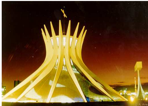
Brasilia: l'avveniristica Cattedrale

una grandissima varietà di alberi. Considerata da alcuni la capitale del terzo millennio la città fu fondata nel 1960. Vetro, marmo ed acciaio fanno di questa città uno spettacolo inconsueto di bellezze contrastanti. Dichiarata dall'Unesco Patrimonio Mondiale, Brasilia è stata costruita con estrema semplicità progettuale: