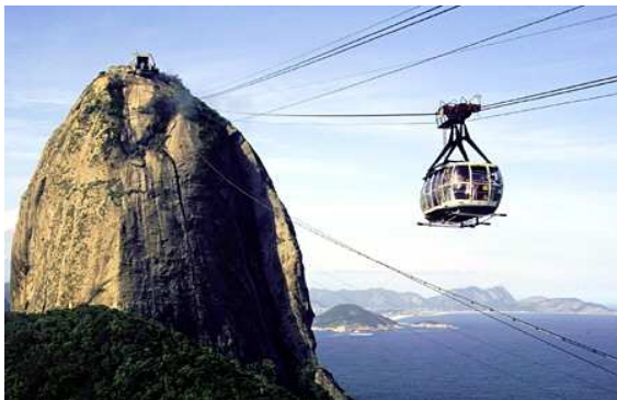
Pan di Zucchero