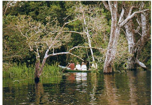
nella Foresta Amazzonica

2 km/ora circa a una temperatura di 22°C, mentre il fiume Rio Solimões corre da 4 a 6 km/ora, a una temperatura di 28°C. Con un po' di fortuna sarà possibile vedere i delfini rosa che, sembra, accompagnano il fiume lungo gli 8 chilometri.