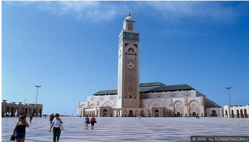
Casablanca: Moschea Hassan II

marocchina. Proseguimento per Rabat , la moderna capitale del Marocco come dimostra l'aspetto cosmopolita e brillante degli ampi viali del centro. Si visiteranno il quartiere del Palazzo Reale (esterno); la Torre Hassan,