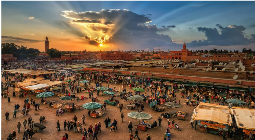
Marrakech - La piazza di Djem el Fnaa al centro del souk

dell'Atlante, Ouarzazate è il punto di partenza per la valle del Draa e la valle del Dades e controlla l'accesso dell'importante strada del Tizi'n Tickha, asfaltata durante il Protettorato e che ha permesso l'attuale sviluppo.